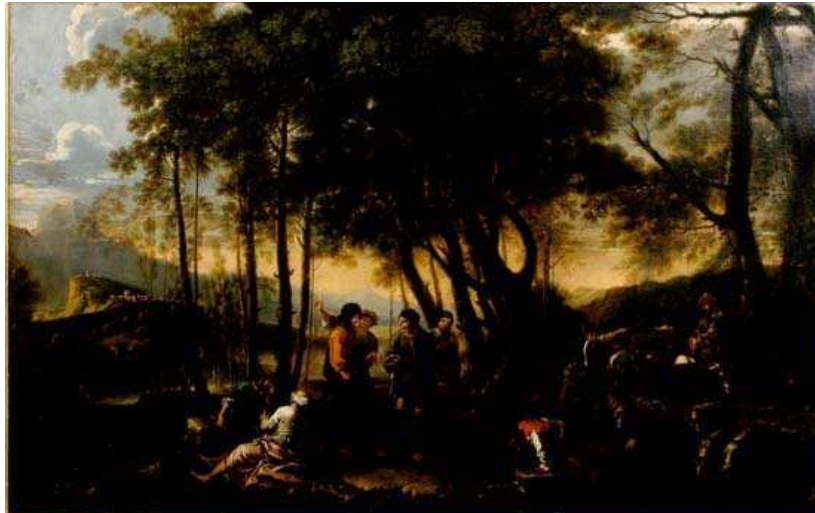
Salvator Rosa, La selva di filosofi (Palazzo Pitti, Firenze)

scienze della natura, attraverso la matematica e la logica, alle scienze umane, mentre la dialettica della natura è già, per sua genesi, un complemento culturale alla dialettica della storia (opponendo modi e forme di flessibilità, ignorati sia dal grezzo materialismo che dall'idealismo astratto). In questo contesto, una serena riflessione sui limiti dell'esistenza umana non è certamente fuori luogo, può svolgersi libera da ogni pesante retaggio ideologico ed intende costruire una prassi comportamentale, capace di accogliere positivamente il futuro e quanto esso riserva.