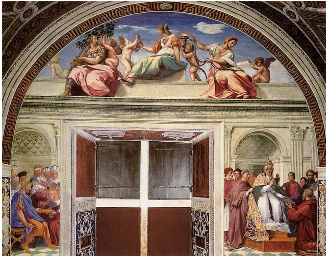
Raffaello Sanzio, Virtù e la Legge (Giurisprudenza) , con: Gregorio IX approva le Decretali, e: Triboniano consegna le Pandette a Giustiniano 124 (Musei Vaticani, Città del Vaticano)

Nulla in base alla pura ragione è di per sé giusto, tutto muta col tempo, non troveremo né la verità né il bene ... Quale chimera è dunque l'uomo? Quale stranezza, quale mostruosità, quale caos, quale soggetto di contraddizioni, quale prodigio, giudice di tutte le cose, debole verme di terra, depositario del vero, cloaca d'incertezza e di errore, gloria e rifiuto dell'universo. Cercate dunque di conoscere, o superbo, quale paradosso siete voi stessi! Umiliatevi, ragione impotente! Tacete, debole natura! Imparate che l'uomo supera infinitamente l'uomo e imparate dal vostro maestro la vera condizione che ignorate. ... La grandezza dell'uomo è grande in quanto si conosce miserabile (Blaise Pascal 125 , Pensieri).